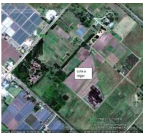
Figura 1: Lote 12c de la Estación Experimental Julio Hirschhorn

La estación total se operó desde una ubicación central en el Lote 12c (de superficie 2 hectáreas), de manera de tener intervisibilidad y dominancia sobre todo el predio. (Fig.1).