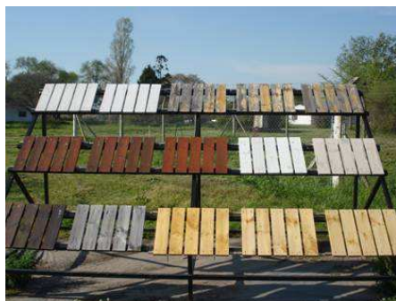
Figura 5: Ensayo de eficiencia de recubrientes en la EEJH.