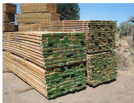
Figura 4: Madera – Aserradero UBAJAY.

6) Acopio y estibado de la madera utilizada en la construcción (Material donado por el Aserradero UBAJAY). Se gestionó y obtuvo la donación de 4 paquetes de madera necesarios para el armado de los paneles de muro, cabriadas y vigas de fundación. La madera es de Eucalyptus grandis , la cual fue secada al aire y cepillada. En el aserradero donante, actualmente se están acopiando además los moldes metálicos para construir las piezas parte y la madera de Eucalipto colorado, adquirida para emplearla en la construcción del deck.