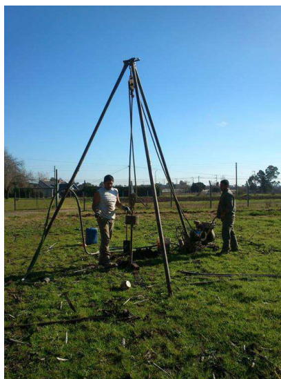
Figura 2: Muestro e identificación del suelo de emplazamiento.