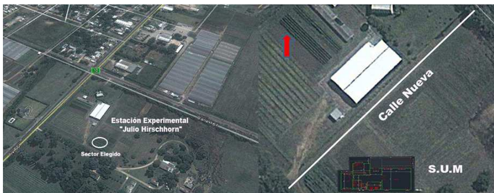
Figura 1: Estación Experimental Julio Hirschhorn.