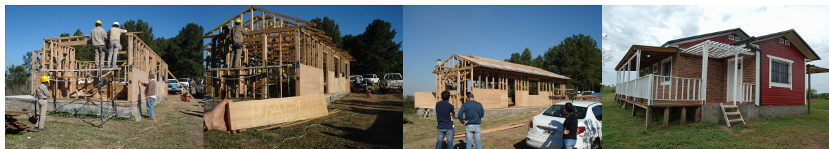
Figura 6: Ejemplo de Sistema constructivo.