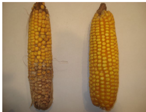
Figura 2: espiga de maíz infectada y sana

Los datos muestran que existen diferencias significativas en el contenido de proteínas solubles y el índice de verdor. El rendimiento, peso de mil granos y número de granos/m 2 disminuyeron significativamente en el tratamiento con Fusarium spp., mientras que no se modificó el peso de los marlos. El número de granos/m 2 fue el parámetro que mejor ajustó con el rendimiento ( R^2=0,86 ). El AS modificó el patrón proteico y contrarrestó el efecto del hongo sobre el rendimiento y sus componentes.