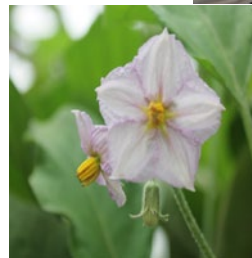
flores de berenjena