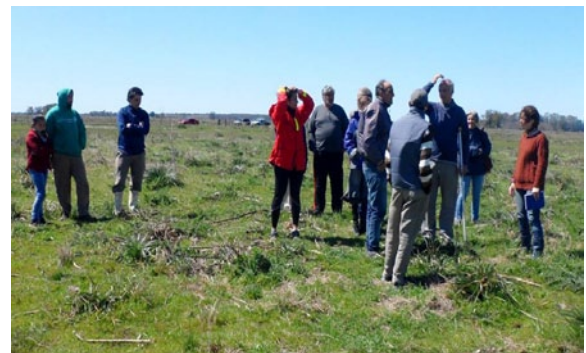
Reunión grupal de productores en el Establecimiento La Chacrita.

Los métodos masivos, se basan en la difusión de la actividad a través de la elaboración de gacetillas sobre distintos temas técnicos con el fin de entregar a los asistentes de las reuniones, charlas y a la comunidad relacionada directa o indirectamente con la producción lechera.