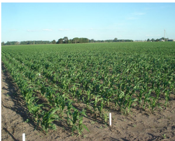
Figura 1: parcelas de ensayo en Pergamino

Nuestros estudios están dirigidos a dilucidar el efecto del ácido salicílico sobre el comportamiento de plantas de maíz inoculadas y no inoculadas con Fusarium spp, en condiciones de campo. Para lograr estos objetivos estudiamos el índice de verdor (SPAD), el contenido de proteínas solubles, el patrón proteico y los componentes del rendimiento. También se realizaron observaciones periódicas de la incidencia de plagas y enfermedades a lo largo de toda la experiencia