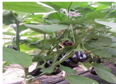
tallos con frutos para cosecha

Adversidades: Se trata de un cultivo muy atractivo para plagas y enfermedades como pulgones, moscas blancas, arañuela roja, gorgojos y chinches. En cuando al manejo de plagas, existe un gran complejo de enemigos naturales de aparición espontánea, que controlan en parte algunas de estas plagas.