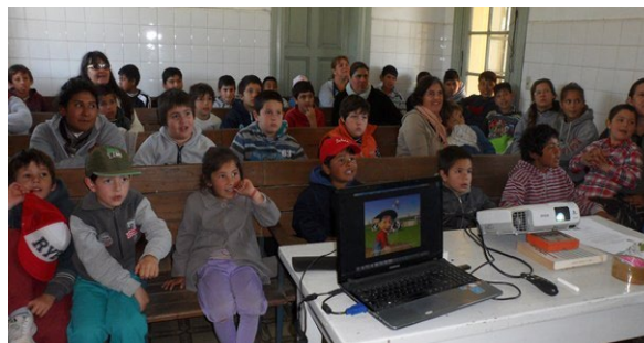
Visita de los alumnos de la Escuela n°5 al tambo Santa Catalina-UNLP. 21 de setiembre de 2015.