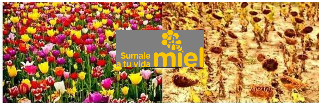
UN MUNDO CON ABEJAS