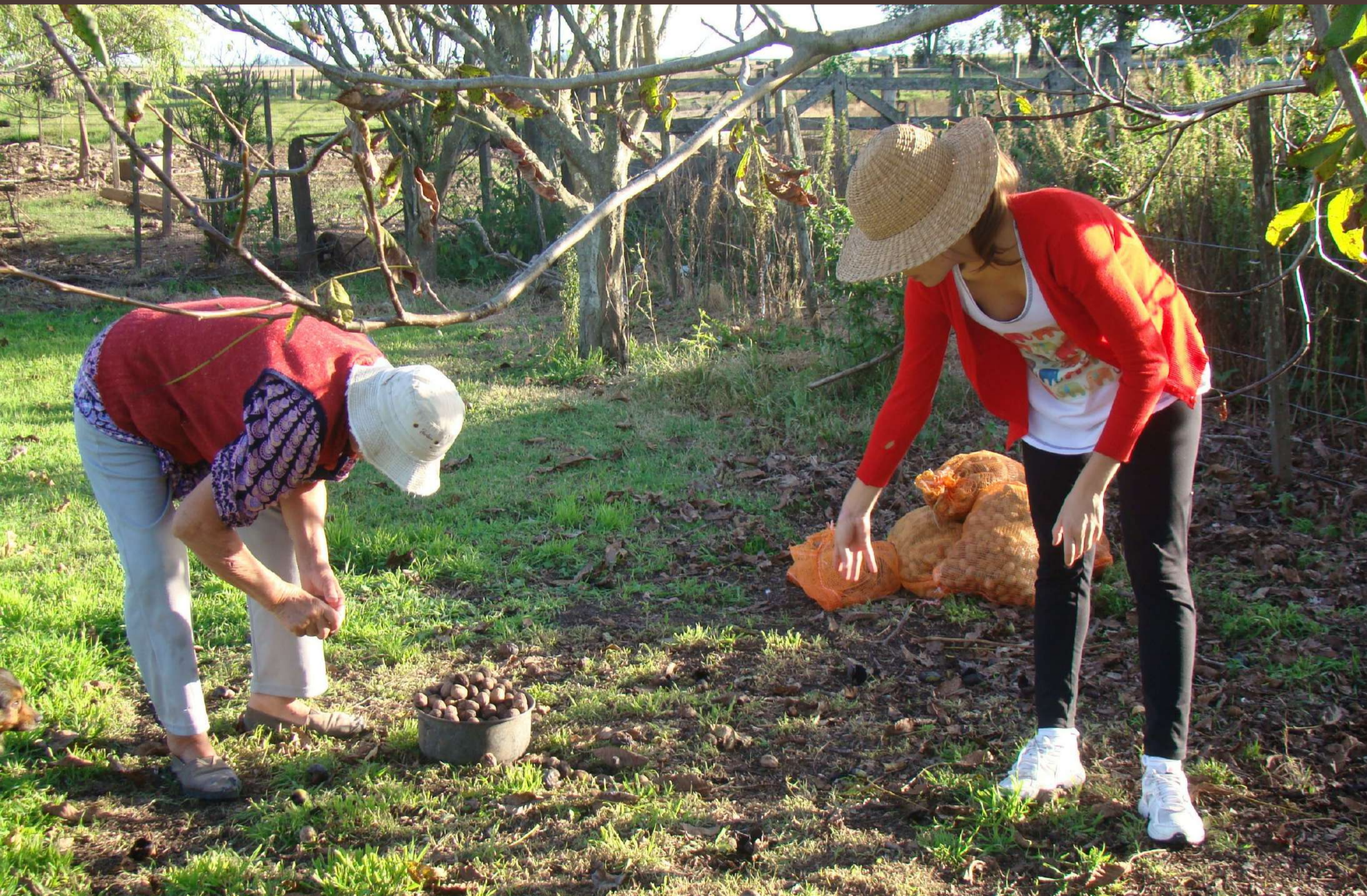
Cosecha de nueces. Depto de Belgrano, pcia. de Santa Fe.