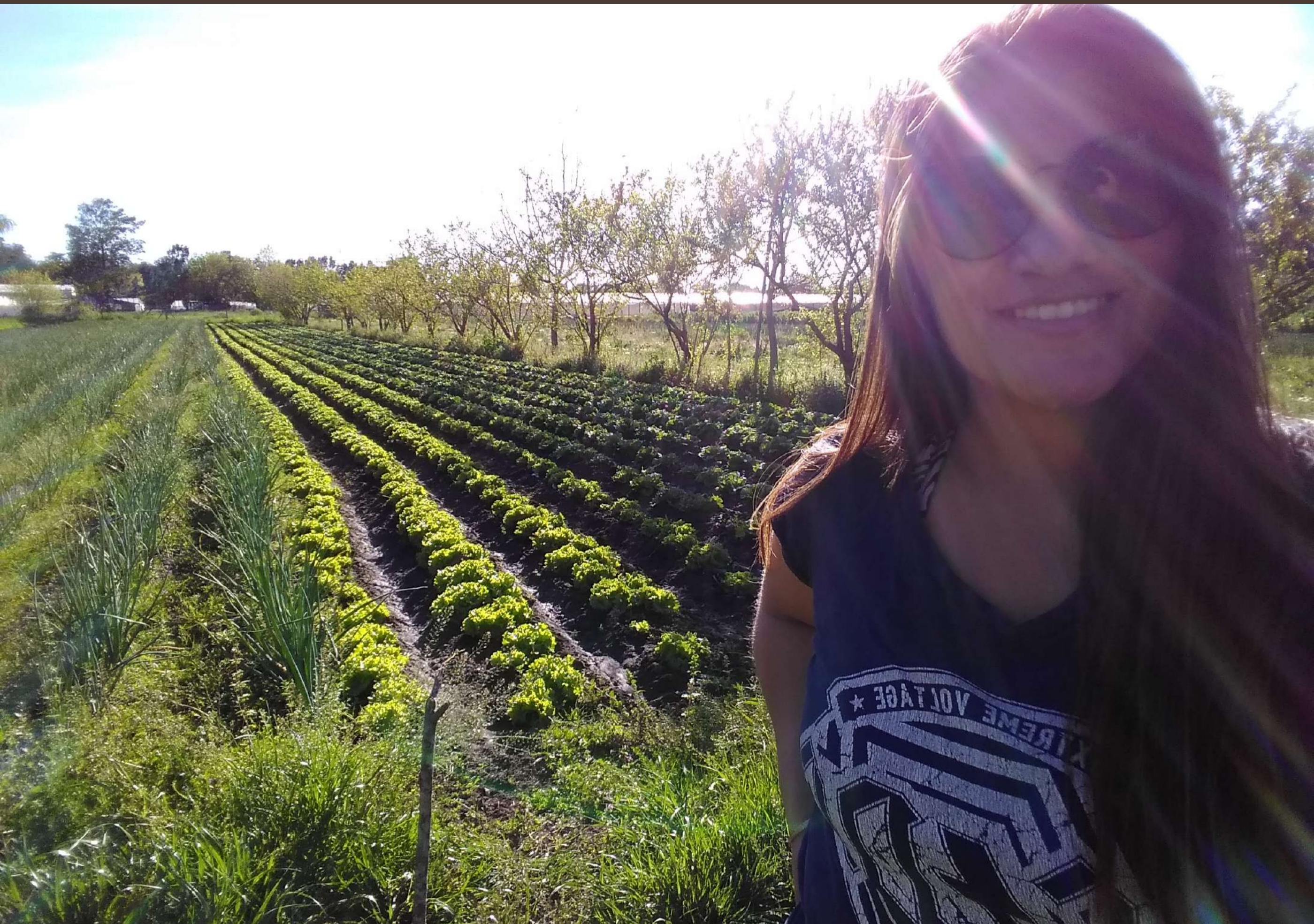
Finca Fruti hortícola Villa, ubicada en Abasto- San Ponciano, La Plata